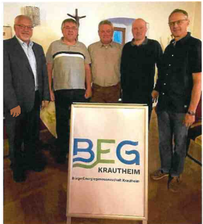
Foto: Neuer Aufsichtsrat 2024