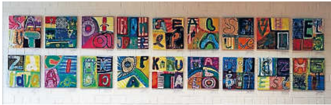
Ausstellung der Willkommensgrüße in der Mensa

den und erfreuen auch jetzt noch in ihrer Einzigartigkeit Groß und Klein. All dies wäre aber ohne die Firma REISSER Schraubentechnik GmbH als Sponsor nicht möglich gewesen. Vielen Dank an dieser Stelle für die Unterstützung. Die Kinder und das Betreuersteam der MES