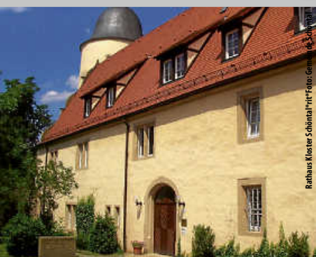
Rathaus Kloster Schöntal | Foto: Gemeinde Schöntal