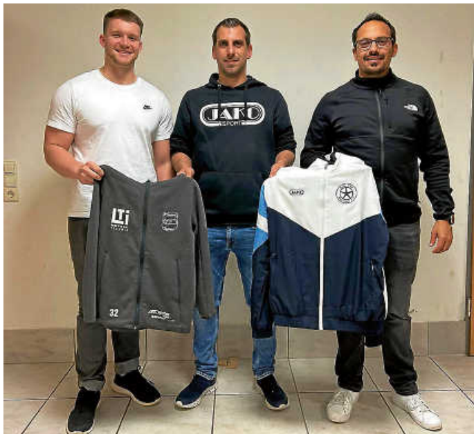
Trainerstab Saison 2024/2025

Mit dem neuen Trainerstab sehen sich die Abteilungsleiter der BBJ als bestmöglich aufgestellt für die neuen Aufgaben und Herausforderungen der ersten Fusionssaison.