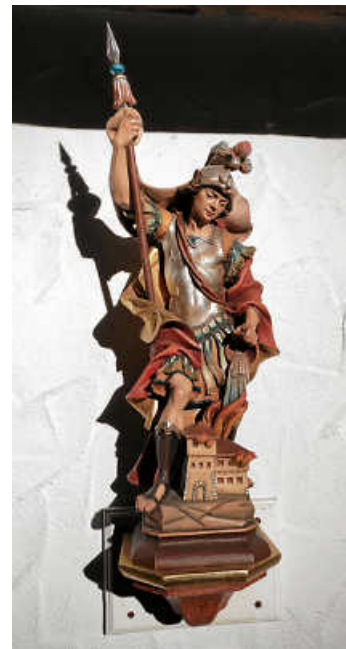
St. Florian

Beginn mit dem Wortgottesdienst um 9.00 Uhr in der Kirche Mariä-Himmelfahrt Sindeldorf. Im Anschluss Weißwurstfrühstück auf dem Schulhof in Sindeldorf.