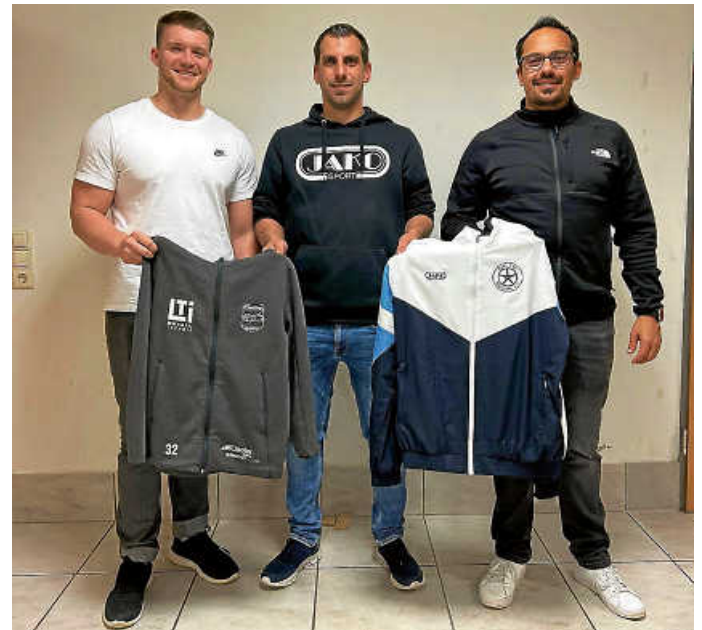
Trainerstab Saison 2024/2025

Mit dem neuen Trainerstab sehen sich die Abteilungsleiter der BBJ als bestmöglich aufgestellt für die neuen Aufgaben und Herausforderungen der ersten Fusionssaison.