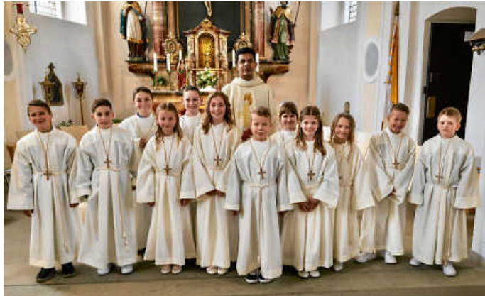
Kommunionkinder aus Marlach, Sindeldorf und Westernhausen

Eure Kommunionkinder aus Marlach, Sindeldorf und Westernhausen