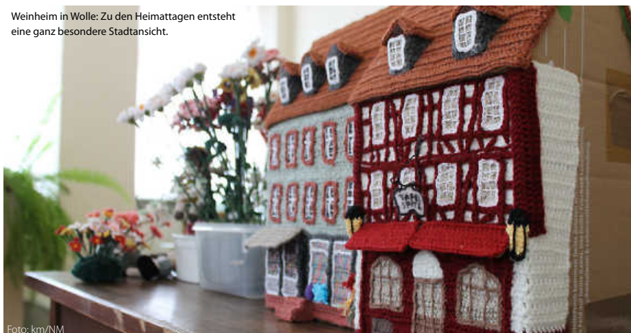
Weinheim in Wolle: Zu den Heimattagen entsteht eine ganz besondere Stadtansicht.

Der Startschuss zu den Heimattagen 2025 fällt am Sonntag, 12. Januar, im Rahmen des Neujahrsempfangs der Stadt Weinheim. Dabei wird Ministerialdirektor Rainer Moser aus dem Landesinnenministerium auch offiziell die Landes-Heimattage-Standarte an OB Manuel Just überreichen. (km/red)