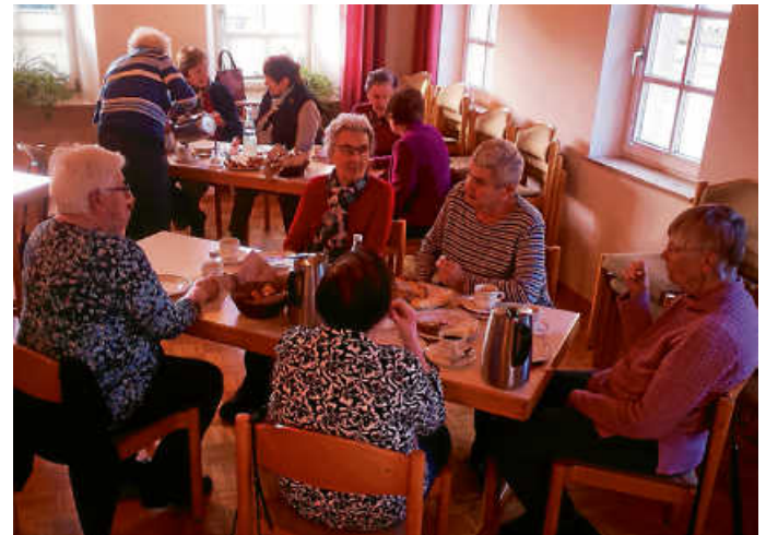
Die Herbstsonnen bei der Stärkung mit Kaffee und Kuchen vor dem Karten-, Brett- und Würfelspielen.

Beratungen können face to face, telefonisch und über Videote- lefonie stattfinden.