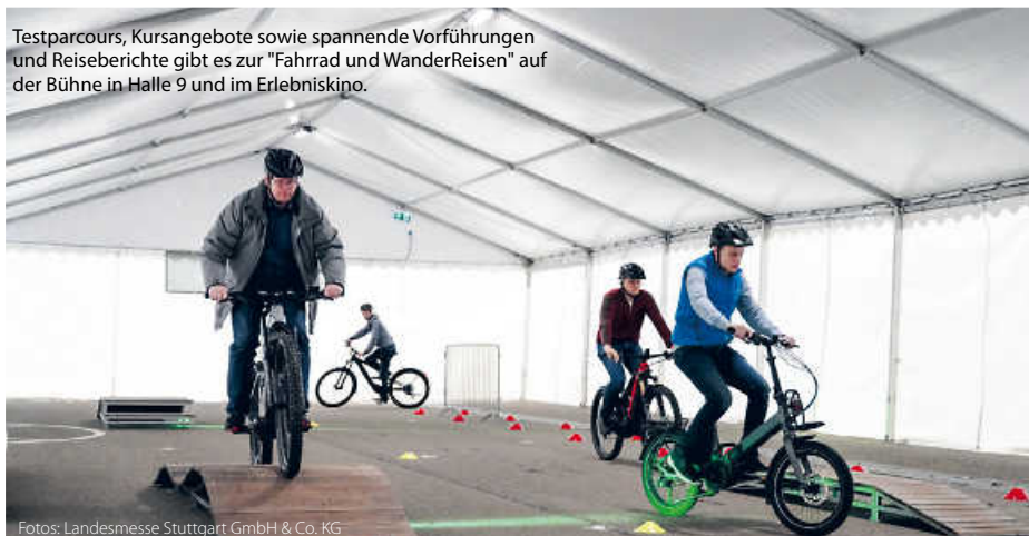
Testparcours, Kursangebote sowie spannende Vorführungen und Reiseberichte gibt es zur "Fahrrad und WanderReisen" auf der Bühne in Halle 9 und im Erlebniskino.

Auch das zweite CMT-Wochenende, vom 23. bis 26. Januar, hält für Aktiv-Urlauberinnen und Urlauber einiges bereit: In Halle 9 zeigen dann Ausstellerinnen und Aussteller, welche Reisen Sie zum Thema Golf, Wellness und Kreuzfahrten in petto haben. Zu entdecken gibt es also wahrlich vieles. Also auf zur CMT. (pm/red)