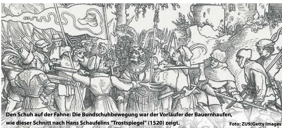
Den Schuh auf der Fahne: Die Bundschuhbewegung war der Vorläufer der Bauernhaufen, wie dieser Schnitt nach Hans Schaufelins "Trostspegel" (1520) zeigt.

In Baden-Württemberg werden den aufständischen Bauern dieses Jahr etliche Veranstaltungen und Ausstellungen gewidmet. So hat das Landesmuseum Württemberg gleich mehrere große Projekte auf den Weg gebracht: Von der Erlebnisausstellung „Protest!“ in Stuttgart über spektakuläre KI-Projekte („Uffruhr!“) in Bad Schussenried, die auch mobil unterwegs ist oder einer Kinderausstellung („Zoff!“). Doch auch an den historischen Stätten im Kraichgau, Heilbronn oder Böblingen ist zum 500. Jahrestag der Aufstände einiges an Programm geboten. (js)