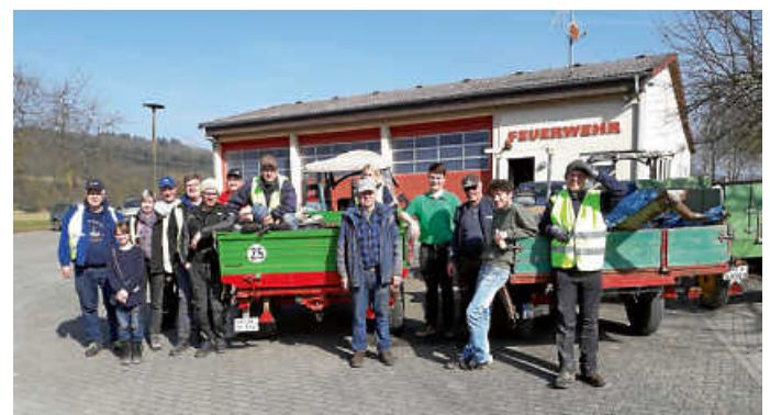
Teilnehmer der diesjährigen Flurputzaktion