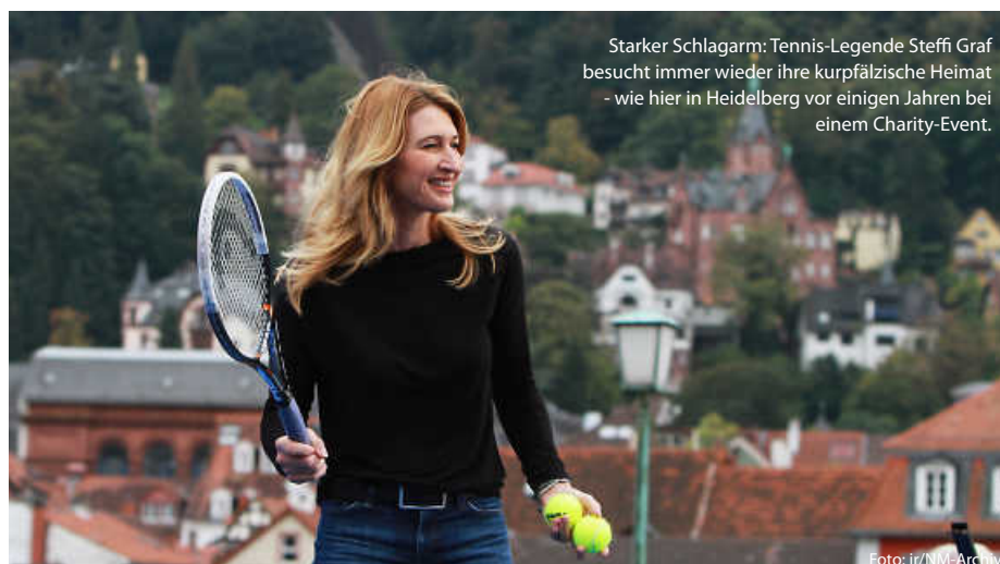
Starker Schlagarm: Tennis-Legende Steffi Graf besucht immer wieder ihre kurpfälzische Heimat – wie hier in Heidelberg vor einigen Jahren bei einem Charity-Event.