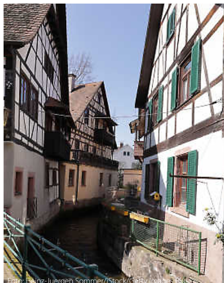
Fachwerkidyll am Ufer der Rench. In Oberkirch ist Heimatgefühl quasi vorprogrammiert.

Und dazwischen? Hier haben die Veranstalter gemeinsam mit einer Vielzahl von lokalen Akteuren, von Winzergenossenschaft bis zum Sportverein, dafür gesorgt, dass kein Wunsch offenbleibt. Von der Weinwanderung bis zur Vogelexkursion: Hier kann man Heimat das gesamte Jahr über erleben, entdecken und genießen. (jr)